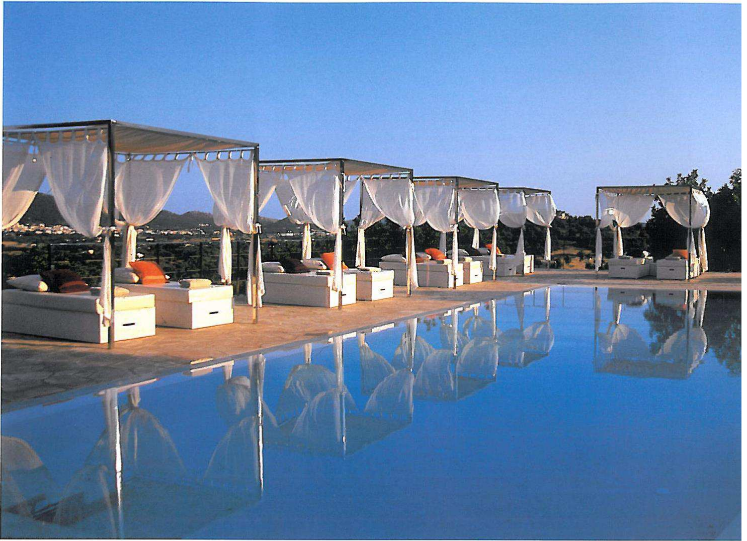
Entspannung auf dem höchsten Punkt des Anwesens versprechen die schattenspendenden Cabanas nach einem erfrischenden Sprung in den großen Swimmingpool.